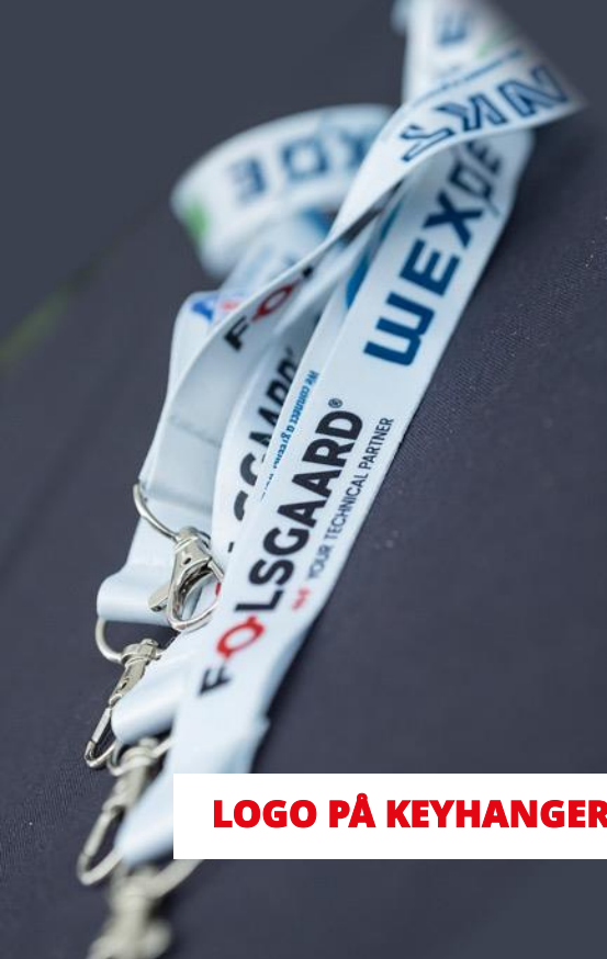
LOGO PÅ KEYHANGER