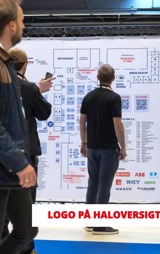
LOGO PÅ HALOVERSIGT