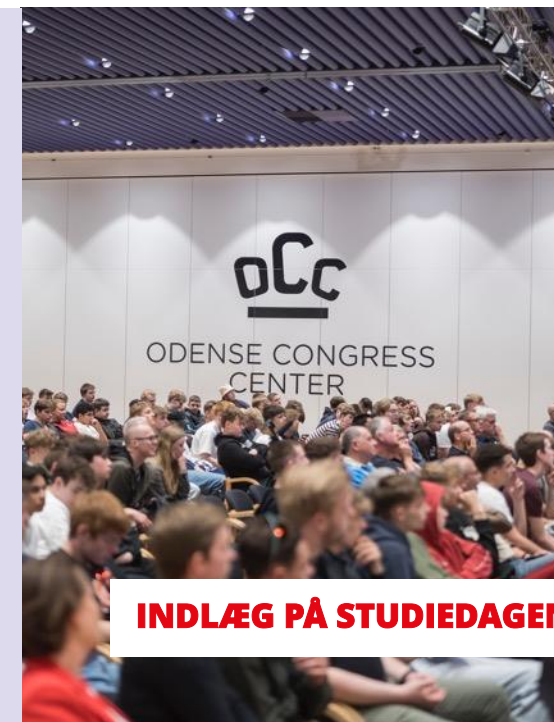
INDLÆG PÅ STUDIEDAGEN