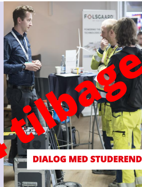
DIALOG MED STUDERENDE