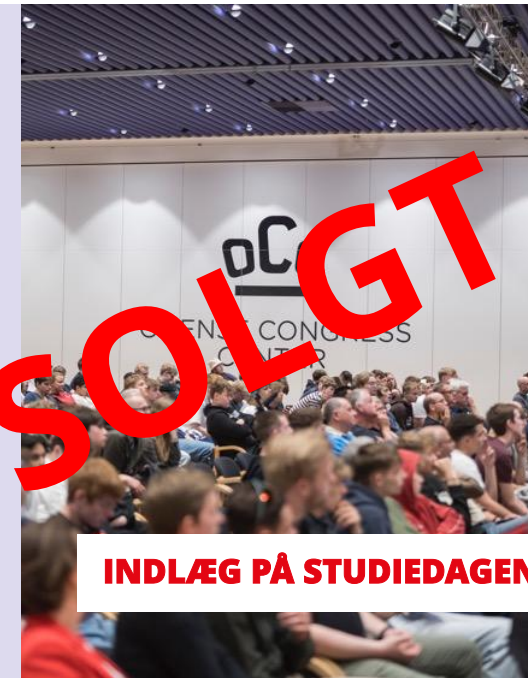
INDLÆG PÅ STUDIEDAGEN