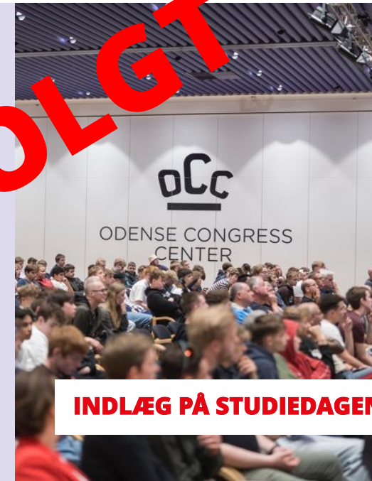
INDLÆG PÅ STUDIEDAGEN