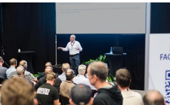
KEYNOTE I ÅBNINGSSSESSION