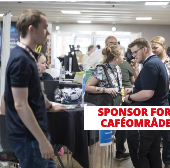
SPONSOR FOR CAFÉOMRÅDE