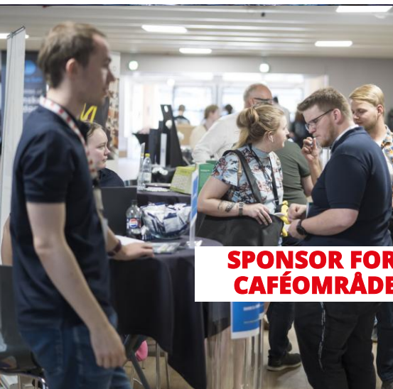
SPONSOR FOR CAFÉOMRÅDE