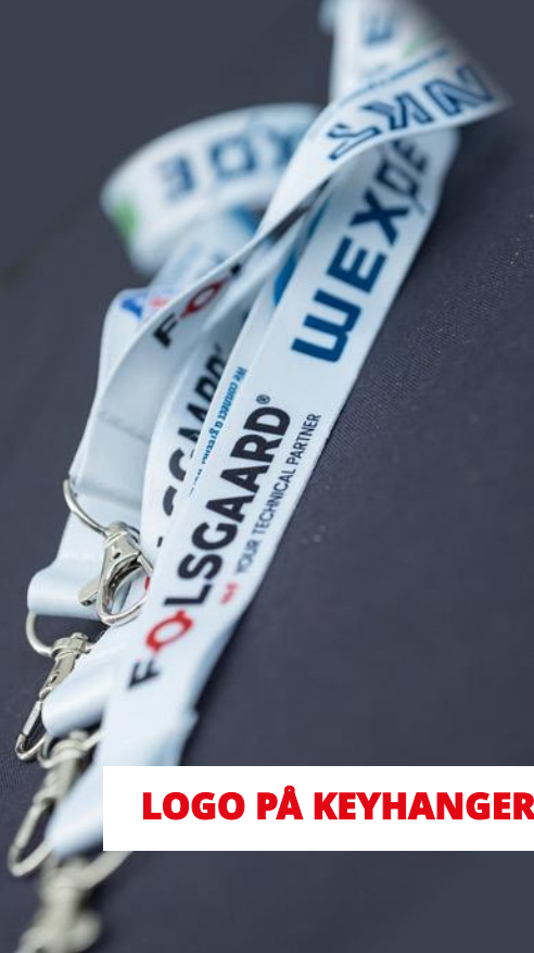
LOGO PÅ KEYHANGER